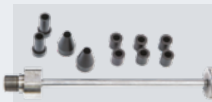
GAR356 (Ø 10 mm) GAR182N (Ø 12 mm)