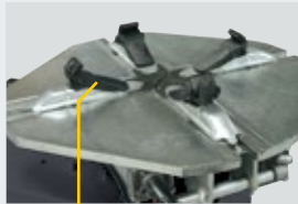
G800A98 → 22" (4 x kit) G800A6 → 26" (4 x kit)