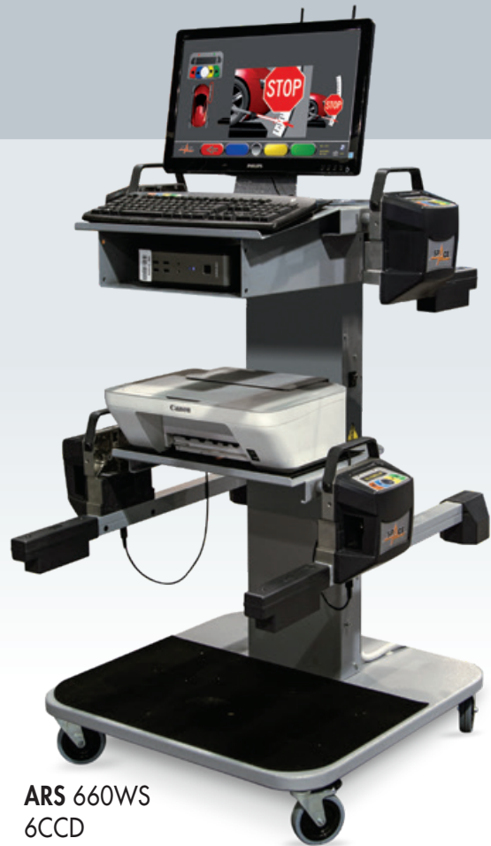
ARS 660WS 6CCD