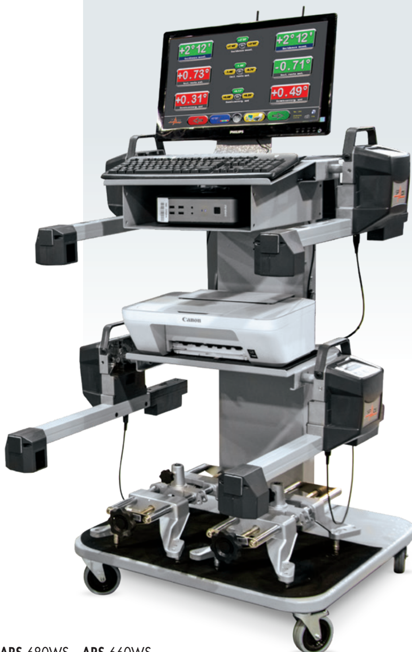
ARS 680WS 8CCD ARS 660WS 6CCD