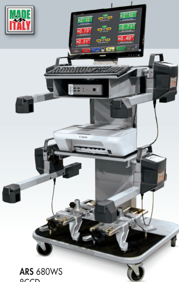
ARS 680WS 8CCD